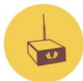
Підключення через Smartbox