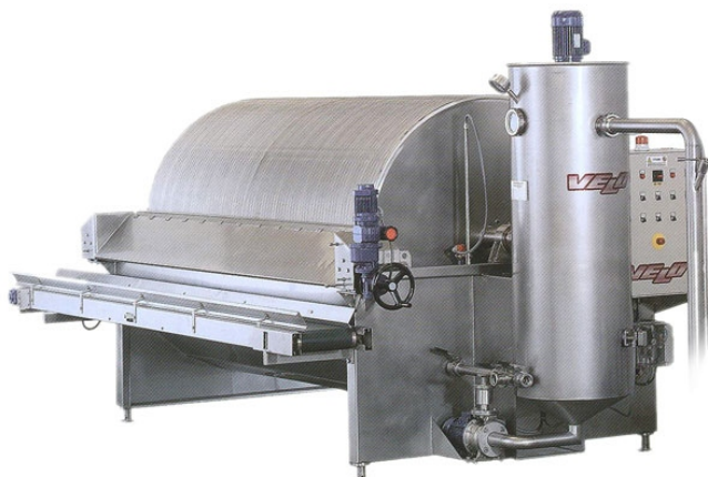
Фильтр FRP 8