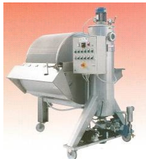
Фильтр FRP 2,5