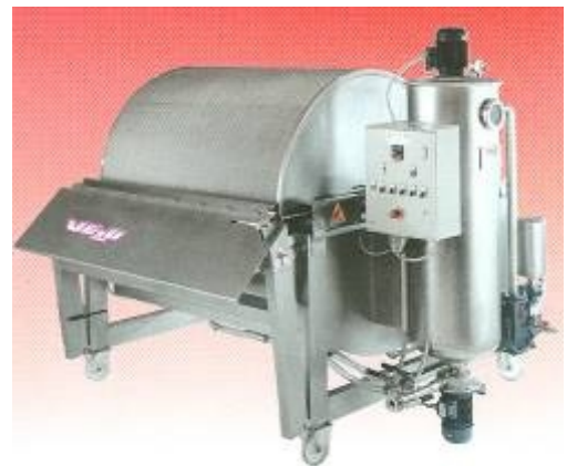
Фильтр FRP 6

однопроходной, с механическим уплотнением, разработан для вакуума; втулка, изготовленная из хромированной и очищенной нержавеющей стали.